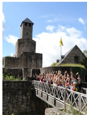
Gruppe: Der indische Trupp(e)