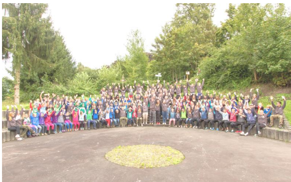
Die gesamte Reisegruppe aus Ebersheim vereint in Colosseum von Homberg (Ohm)

Und eins steht fest - 2015 starten wir wieder in zehn neue erlebnisreiche Tage!